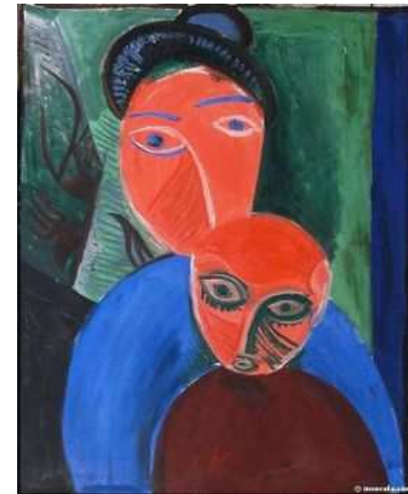
Pablo Picasso 1907 mère et enfant