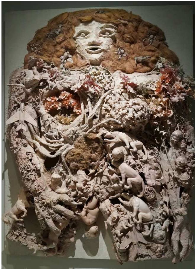
Accouchement rose 1964 NDSP