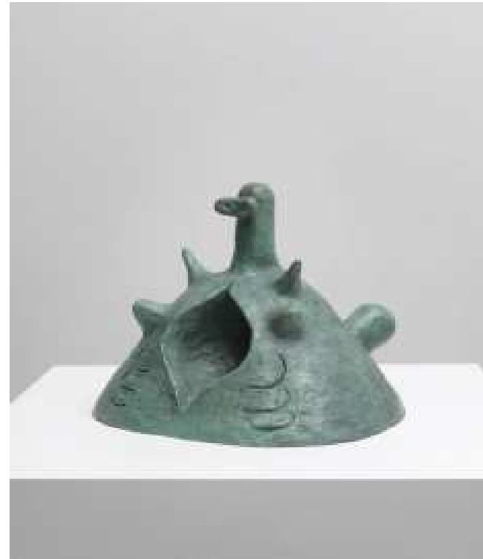
Joan Miro grande Maternité 1973