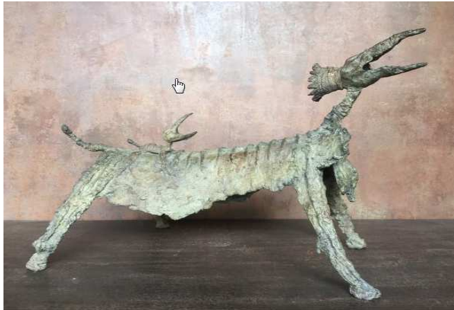
Michael Jacucha Bronze, maternité