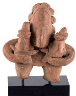
Maternité avec deux enfants Terre cuite beige orangée (manque le nez d'un des deux enfants)

Colima, Mexique Occidental, 100 av - 250 ap. JC