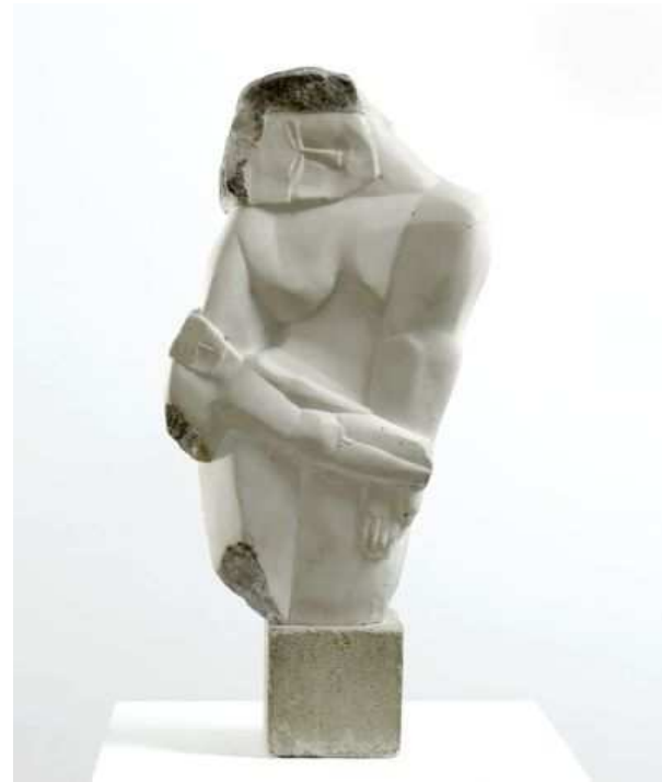
Ossip Zadkine. Maternité , 1919. Marbre partiellement teinté.