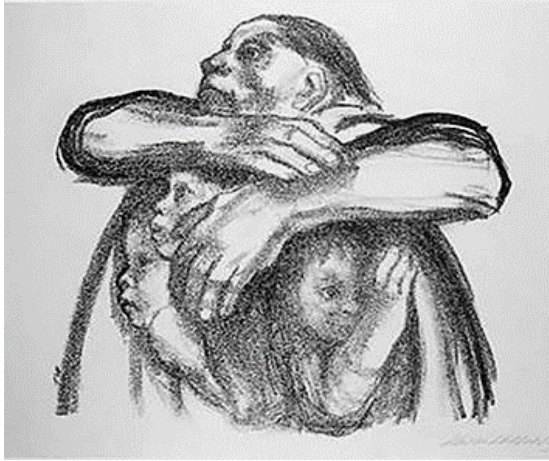
Käthe Kollwitz, Saatfrüchte sollen nicht vermahlen werden, 1941, Käthe Kollwitz-Museum Berlin.