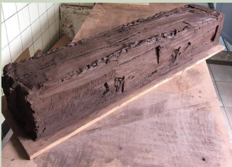
« Maman » en cours de fabrication.

Maman est « le » thème récurrent et pourtant inépuisable que je souhaite explorer à mon tour. Je l'ai souhaitée droite, juste, avec ses failles mais jamais défaillante, un roc, un pilier, un appui, un soutien. 2 faces noires et 2 autres vives, pour exprimer la dualité de chaque être. Il s'agit là de célébrer la rencontre humaine, la confrontation technique et l'œuvre sensible où la beauté s'unit à l'émotion.