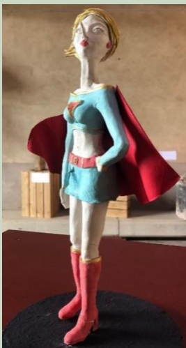
Wonderwoman quelle mytho ! concours Maman ! Juillet 21

Et toujours sur le site www.potesaufeu.art