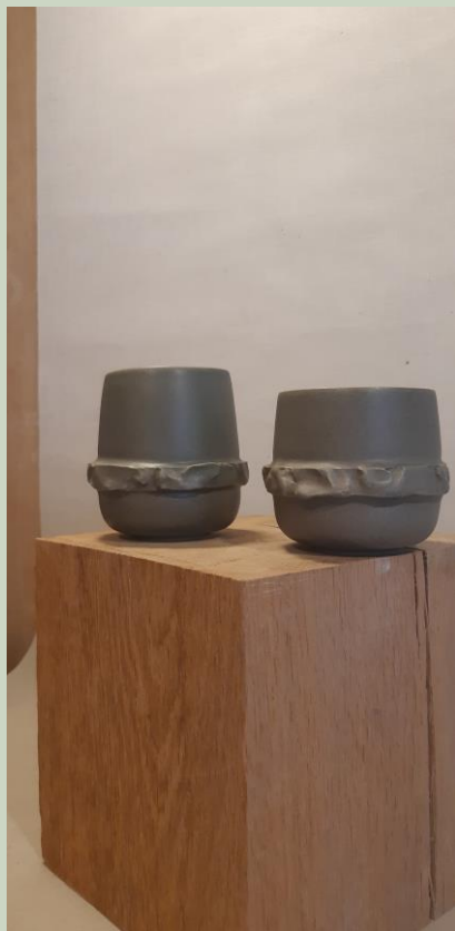
Tasses série Cernes Vase Artichaut #2 Détail de Jarre – Les Gueniches – ors & reliefs