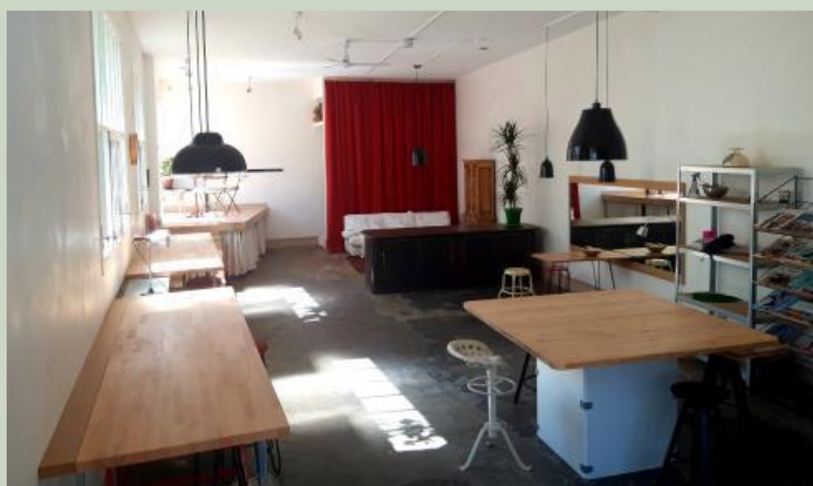
Avant - après