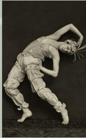
E.O. Hoppé, Tamara Karsavina, "Scheherezade" 1912 Pinterest extraction

Lorsque le quotidien est centré sur le temps de la terre et le rythme de l'atelier, je me livre à une danse sereine et exaltée, patiente et frénétique, élégante et puissante, un charmant combiné de ballet et de claquettes électro (je vous laisse imaginer ce que cela peut donner !)